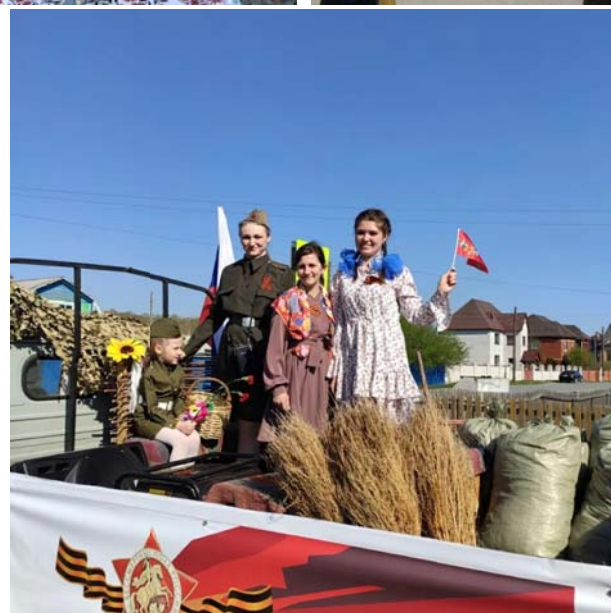
Члены активного долголетия «Блогер-бабушка» на празднике Победы!